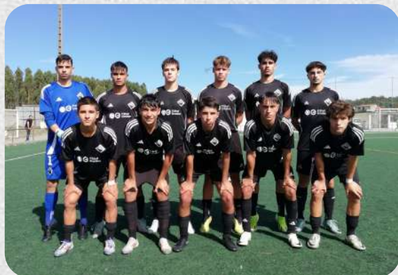
GD Pelariga - Académica (II Divisão Nacional Sub-19)

Durante o mês de setembro, os nossos Sub-19 realizaram dois jogos, a contar para a primeira fase da II Divisão Nacional, tendo obtido 2 vitórias!