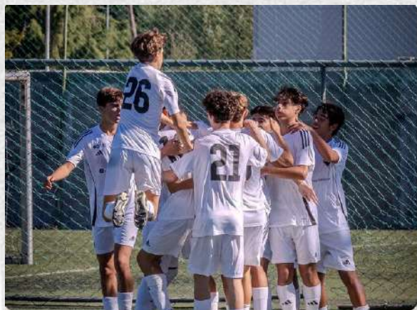
Académica - CF Marialvas (II Divisão Nacional Sub-15)

Praticamente todo o mês de setembro foi dedicado à pré-temporada da equipa de Sub-15, uma vez que a 1.ª jornada da II Divisão Nacional foi disputada a 29 de setembro.