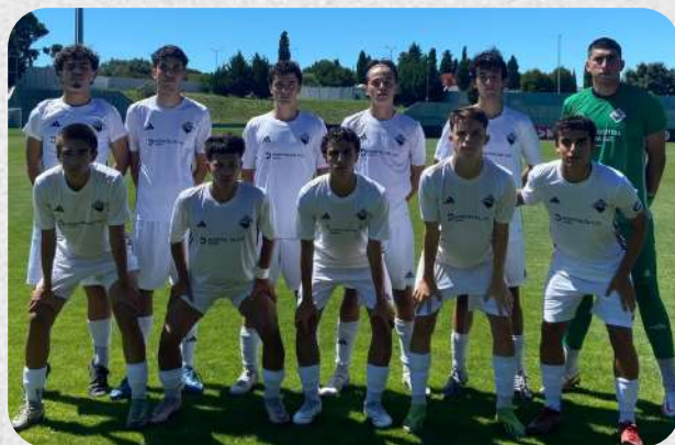
SL Benfica - Académica (I Divisão Nacional Sub-17)

Após essa interrupção, a nossa equipa realizou três jogos. Na receção ao Torrense, num jogo bastante disputado, o adversário acabou por vencer pela margem mínima, enquanto que frente ao Sporting CP, o adversário mostrou-se claramente superior, vencendo por 6-0. Na visita ao Casa Pia AC, a nossa equipa saiu novamente derrotada (3-0), apesar dos esforços dos atletas.