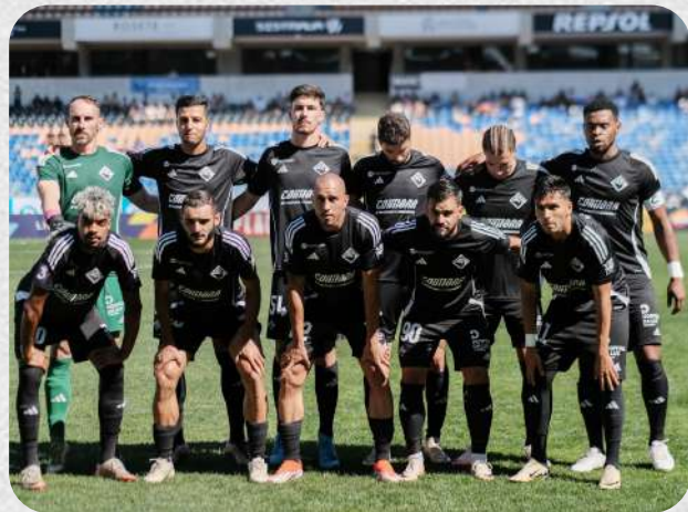
Académica - Atlético CP (Liga3)