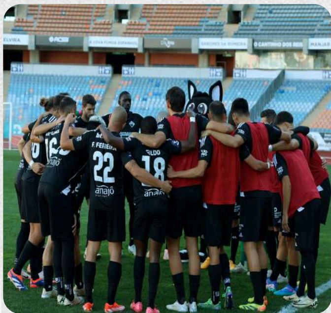
Académica - Caldas SC (Liga3)